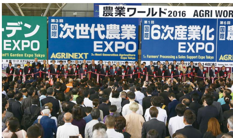
2016年10月開催農業ワールド(@千葉幕張メッセ):テープカットの様子

★取材をご希望の方は、下記申込書をFAXでお送りいただくか http://www.nogyoworld.jp/shuzai/ からお申込みください。